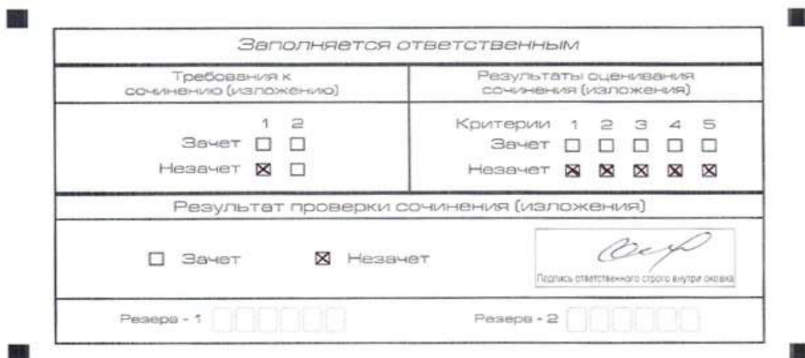
Рис. 7. Область для оценки работы

Эксперт комиссии (ответственное лицо, технический специалист 1 ) выставляет «незачет» за невыполнение требования № 2. В клетки по всем критериям оценивания выставляется «незачет». В поле «Результат проверки сочинения (изложения)» ставится «незачет».